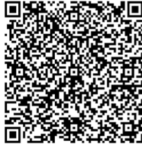
Figura 7.2: Exemplo de cédula, com o voto impresso em formato claro, e em formato cifrado na forma de um código de barras. O eleitor dobra sobre a parte legível e entrega a cédula a um mesário. Posteriormente o código de barras é escaneado, e então a cédula é dividida em duas. A parte de texto simples dobrada é depositada em uma urna, enquanto o código de barras é devolvido ao eleitor como um recibo.

Dep Est : 7777 Vinicius de Moraes Gov : 88 Machado de Assis Dep Fed : 7777 Euclides da Cunha Senador : 88 João Ubaldo Ribeiro Pres : 99 Guimarães Rosa